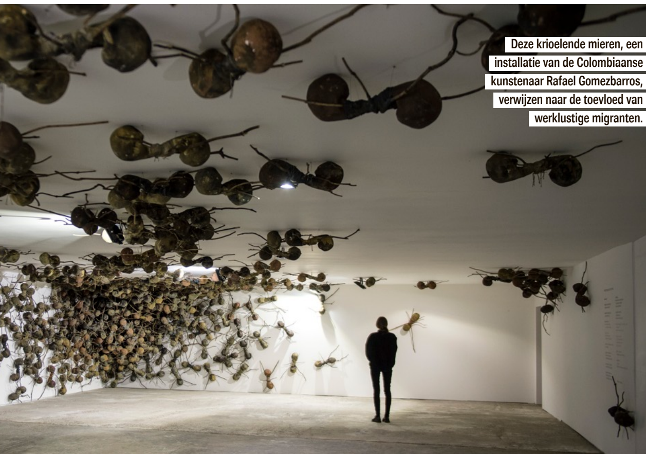
Deze krioelende mieren, een installatie van de Colombiaanse kunstenaar Rafael Gomezbarros, verwijzen naar de toevloed van werklustige migranten.

migratie- en vluchtelingenstromen van vandaag. En vanzelfsprekend komt daar, naast veel onmenselijkheid, een portie mededogen bij kijken. Maar dat was geen dwingend thema en er zijn gelukkig ook originele en meer speelse werken die een totaal andere richting uitgaan.